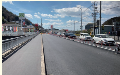
皆森・谷上間3車線化

その実現後に、今なお残る皆森交差点での渋滞緩和策として箕谷ランプ信号の改善を要求するつもりです。