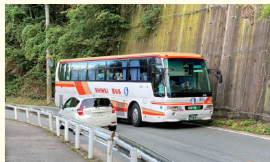
皆森・谷上間3車線化