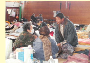
■ 東日本大震災時に何度も被災地を訪問