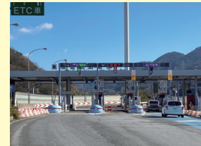
■ 新神戸トンネルの阪神高速への移管に尽力