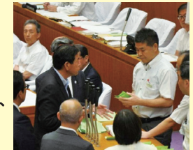
■ 議場でも納得いかないことはひかない