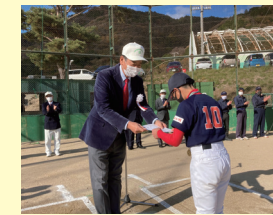
■ 少年野球を継続して支援