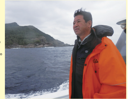
■ 尖閣諸島を守るため与党国会議員として視察 (バックは魚釣島)